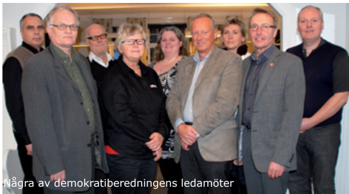
Några av demokratiberedningens ledamöter