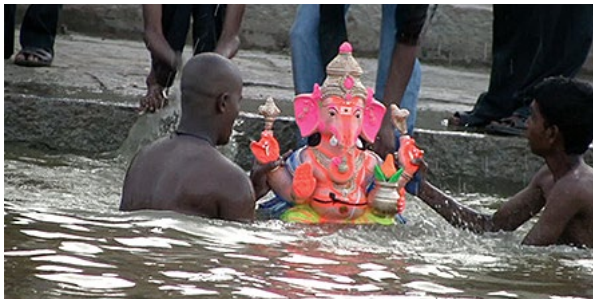
Tade (Impediment) av Smriti Mehra

Filmen Tade (Impediment) är en visuell utforskning som visar efterdyningarna av nedsänkingsritualen för Ganeshikoner vid Ganesh-Chaturthi-ritualen. Traditionellt var ikonerna tillverkade av jord. Efter dyrkandet av ikonerna återgavs den till jorden genom att nedsänkas i vattnet. Detta representerar skapelsecykeln. Grundtanken går numera förlorad i utförandet av ritualen då materialen som används för ikonerna inte längre löses upp i vatten.