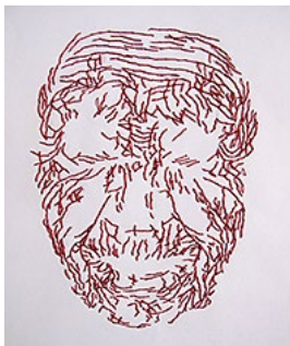
Utan titel av Sabine Öllerer