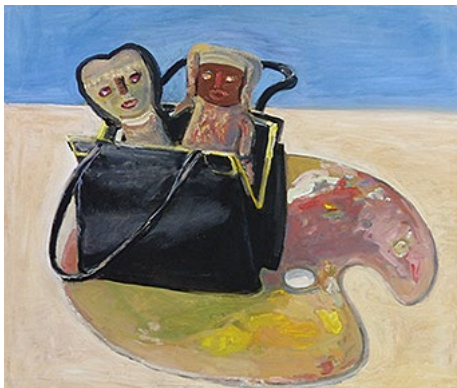
Utan titel av Lena Cronqvist

Lena Cronqvist (f. 1938) är utbildad vid Kungliga Konstakademien i Stock- holm 1959–64. Hon bor och arbetar i Stockholm och på Koster i Bohuslän. Hon har sedan sin första separatutställning 1965 en central plats i svenskt konstliv.