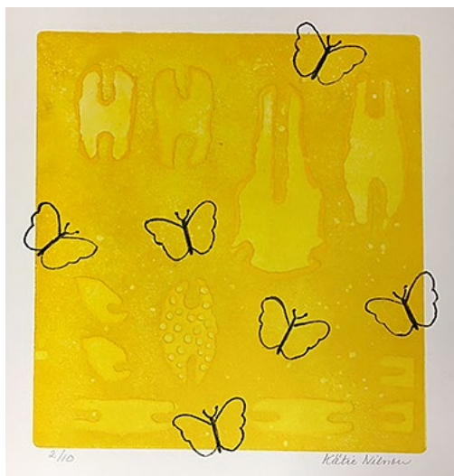
Fjäriln vingad av Käthe Nilsson