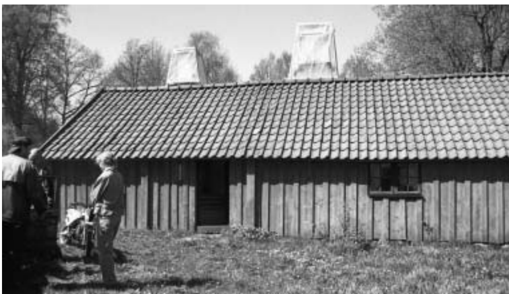
Rumpebolsstugans framsida inför restaureringen. Byggnaden hade då tegeltak och skorstenarna var inbyggda med regnskydd.

År 1969 blåste ett jätteträd ner på stugan, som klarade sig förhållandevis bra. Vid denna tidpunkt lades taket om med tegel. En restaurering genomfördes även omkring 1980.