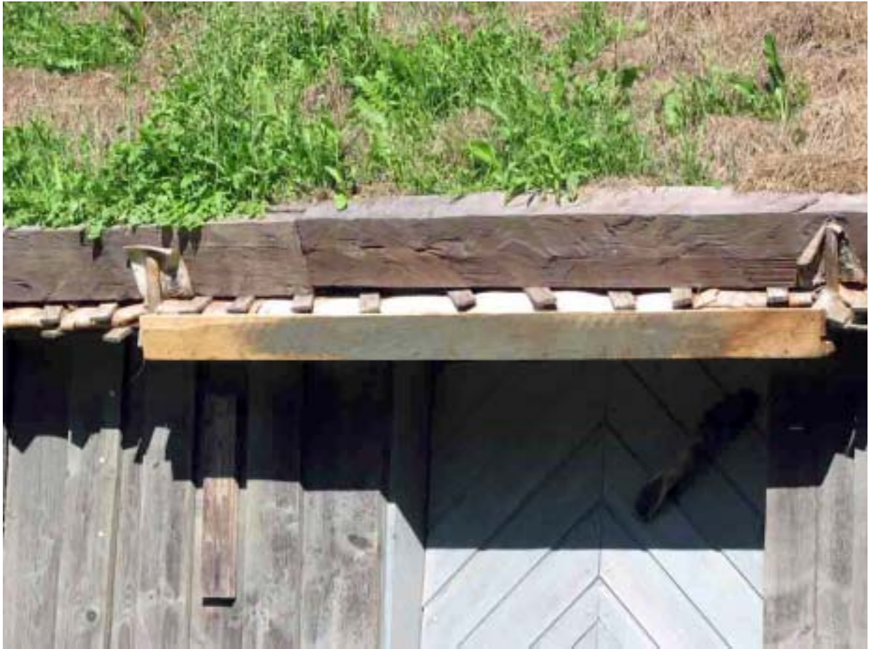
Detalj av takfoten med takskäggsförlängningen.

Bakugnen putsades om med lerbruk invändigt. Samtliga eldstäder målades med limfärg i vit kulör. Delar av väggarnas timmerstomme lagades med nytt timmer. Innertaket i stugan lagades, patenterades en gång och ströks med vit limfärg. Taklisten i kammaren var platt och av sentida typ. Den byttes ut mot en lätt fasad list. Eftersom delar av putsen på skorstenen över tak frös sönder under vintern 2005/2006 företogs putslagning på skorstenen.