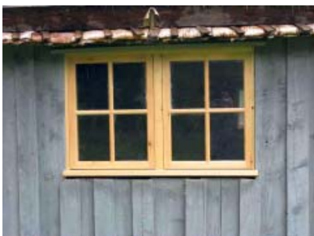
Framsidas fönster efter restaurering.