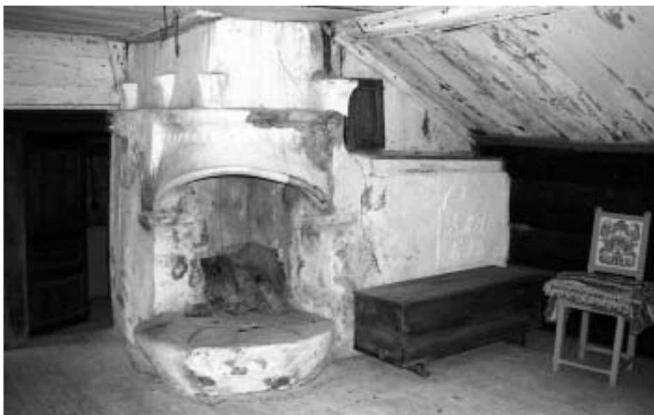
Stugrummet inför restaureringen. Eldstaden har omfattande skador från vattenläckage.

Stugan, som är belägen på ursprunglig plats, är uppförd av timmer i en våning med fasad av lockpanel. Fönsterna har olika format och spröjsar av både trä och bly förekommer. Byggnaden har ett sadeltak belagt med enkupiga tegelpannor av två olika typer – ett med sk vingtegel mot framsidan och ett med falstegel mot baksidan. På taket finns två skorstenar murade av fältsten och putsade. Byggnaden vilar på en sockel sten. Invändigt är den äldre rumsindelningen bevarad liksom äldre fast inredning, bl a en väggfast säng.