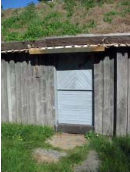
Huvudingången efter restaureringen.