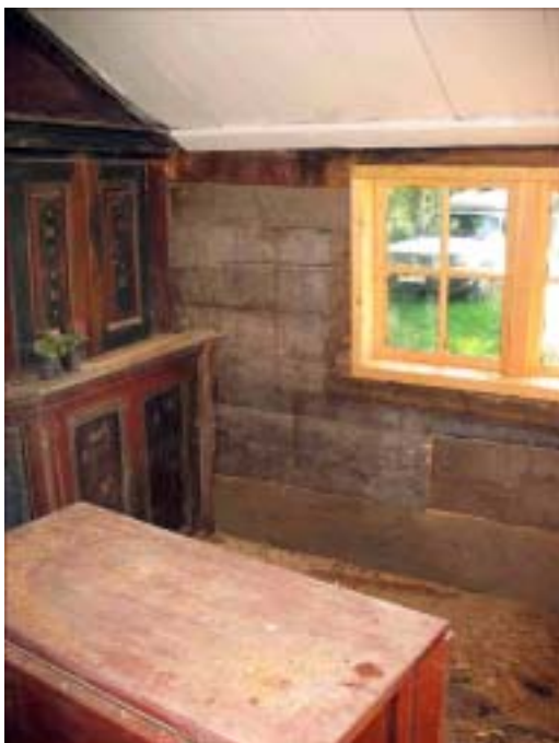
Timmerlagningar i storstugan.

Bakugnen putsades om med lerbruk invändigt. Samtliga eldstäder målades med limfärg i vit kulör. Delar av väggarnas timmerstomme lagades med nytt timmer. Innertaket i stugan lagades, patenterades en gång och ströks med vit limfärg. Taklisten i kammaren var platt och av sentida typ. Den byttes ut mot en lätt fasad list. Eftersom delar av putsen på skorstenen över tak frös sönder under vintern 2005/2006 företogs putslagning på skorstenen.