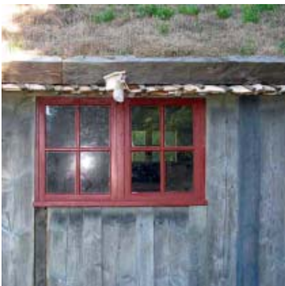
Fönster efter restaurering.