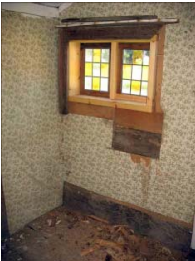
Timmerlagningar i kammaren.