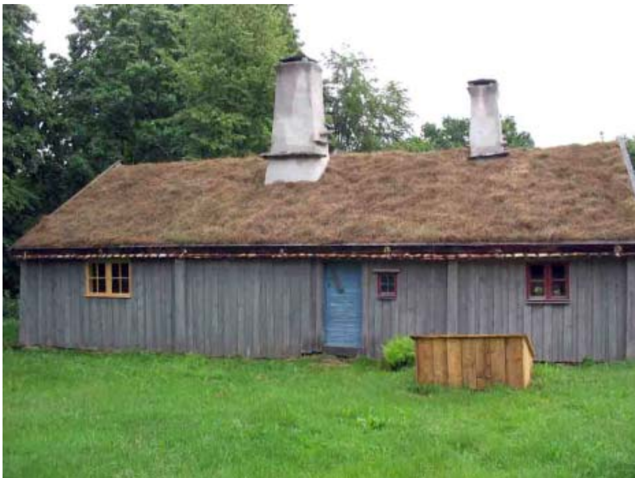
Byggnadens baksida efter avslutade arbeten.

Slutligen restaurerades byggnadens två ytterdörrar. Dessa målades i gråblå, platsblandad kulör. För att skydda mot vattenstänk vid entréerna sattes två hängrännor av trä upp vid dessa. Dessa utformades av brädor av ek i V-form.