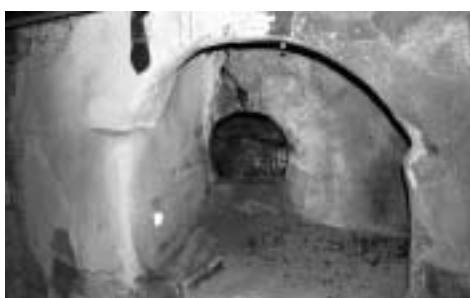
Detalj av eldstaden med mynningen till bakugnen.