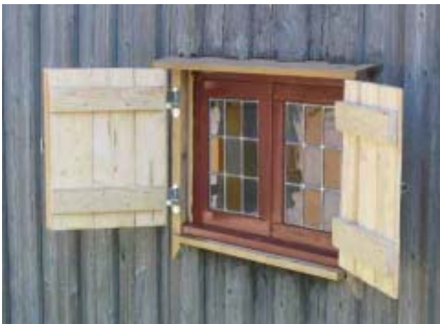
Det blyspröjsade fönstret med nya luckor.