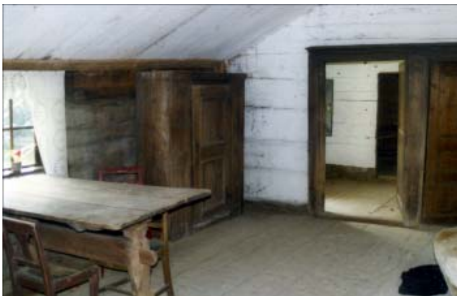
Stugrummet inför restaureringen.