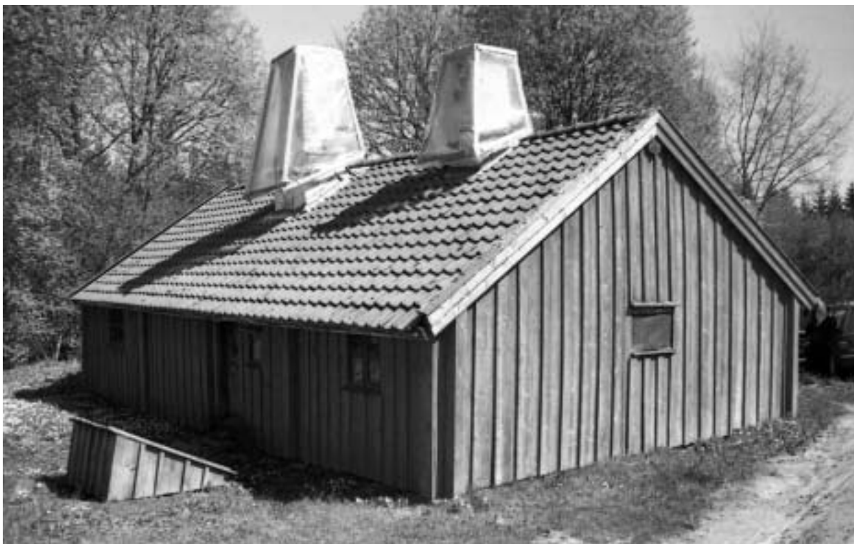
Rumpebolstugans baksida inför restaureringen. Byggnadens framsida hade vingtegel medan baksidan var försedd med falstegel.